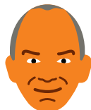
Dr. Dietmar Woidke Ministerpräsident des Landes Brandenburg

„In diesem ganz besonderen Jubiläumsjahr begrüßen wir in Berlin, Potsdam und Wittenberg die Besucher aus aller Welt besonders herzlich: seien Sie willkommen! Aus der Region soll eine Nachricht rund um die Erde gehen: die christliche Botschaft lebt und wir lassen uns die Zuversicht nicht nehmen.“