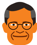
Michael Müller Regierender Bürgermeister von Berlin

„Vom Berliner Kirchentag im Jubiläumsjahr der Reformation wird ein positives Signal in die Welt hinausgehen. Lassen Sie uns gemeinsam dafür sorgen, dass die feierliche und fröhliche Stimmung dieser Tage Zeichen der Zuversicht weit über die Grenzen der Stadt setzen hilft.“